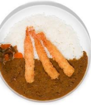
Ebi furai curry

Riz au curry façon japonaise. Notre sauce est à base de porc. Japanese curry on rice. Our sauce is made with pork .